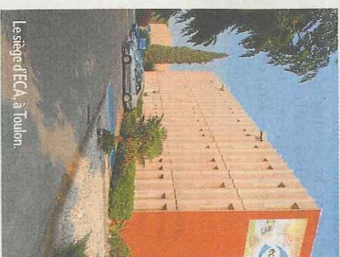
Le siège d'ECA, à Toulon

ECA emploie près de 600 personnes dont 80 à l'étranger. Ces deux dernières années, le groupe a recruté plus de 40 collaborateurs. Souhaitant associer ses salariés plus étroitement à son essor, il leur a réservé, début 2010, une augmentation de capital qui leur permet de détenir 0,5 % des parts. « Nous réfléchissons à une nouvelle opération pour 2011. Nous souhaiterions en effet doter ECA d'un actionariat stable plus important », confie Dominique Vilbois.